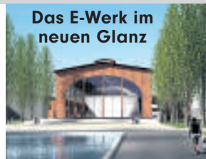
Das E-Werk im neuen Glanz